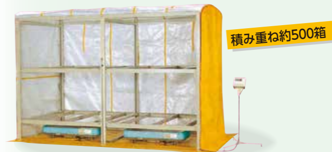
KL-500HN 525,140円(税込) 477,400円(税抜)