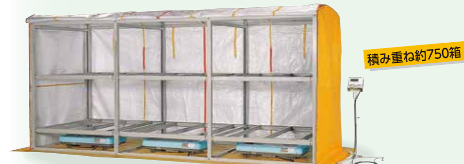
KL-750HN 748,000円(税込) 680,000円(税抜)