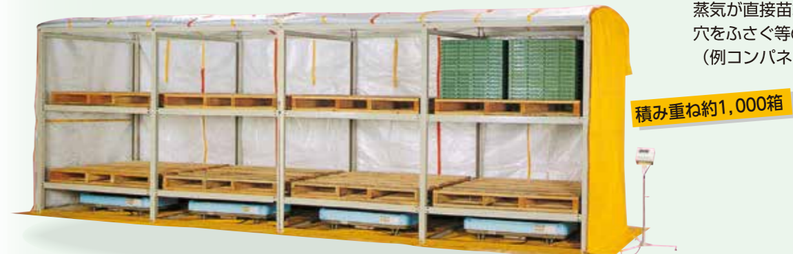
KL-1000HN 871,200円(税込) 792,000円(税抜)