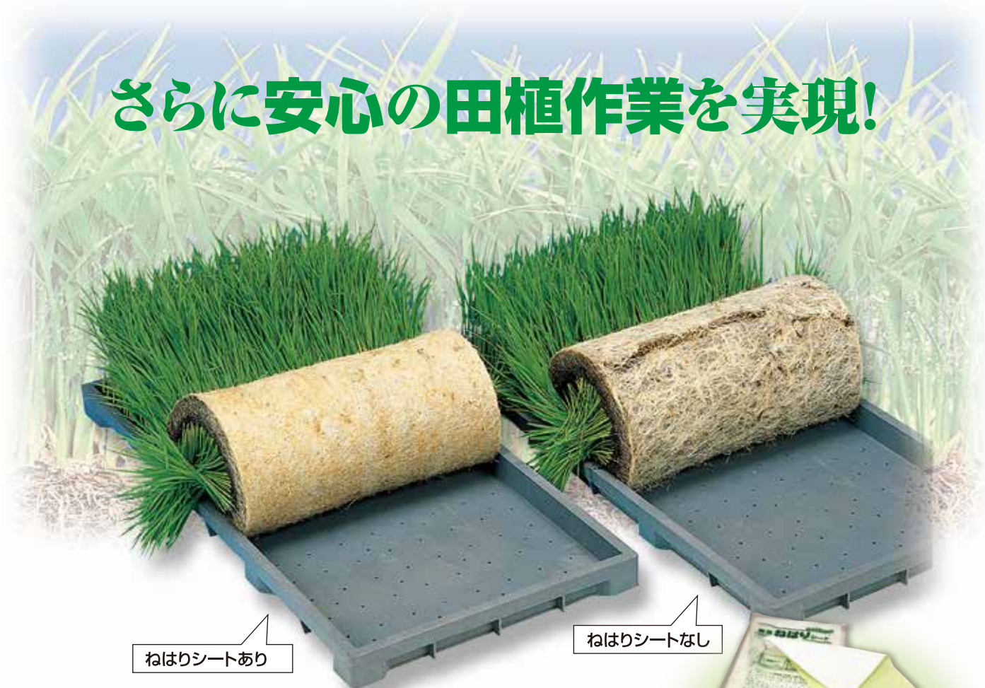
ねはりシートあり