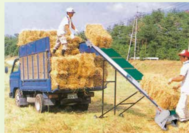
サン付きベルトによる牧草の積み込み