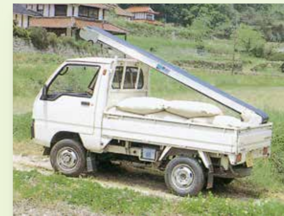
軽トラにも楽々搭載