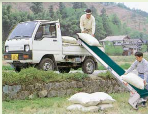
軽コンは高い畦道でも楽に積み込みます