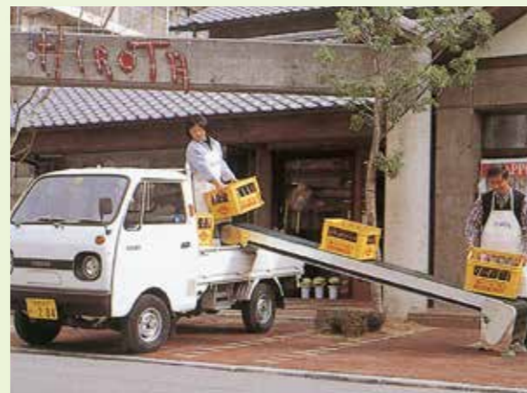
コンテナ箱の積み込み